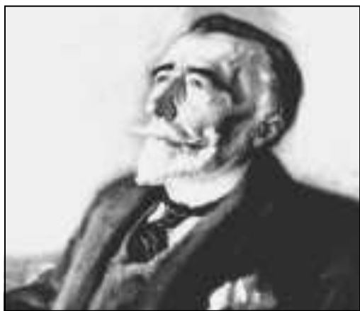
Lo scrittore Joseph Conrad

A 150 anni dalla nascita, la Biblioteca Europea col Cinema dei Piccoli e l’Istituto Polacco di Cultura dedica a Roma dal 4 marzo al 26 aprile un omaggio con convegni, cinema, letture e una mostra a Joseph Conrad (1857-1924), nobile polacco diventato marinaio britannico, profondo conoscitore della cultura francese e maestro della prosa inglese.