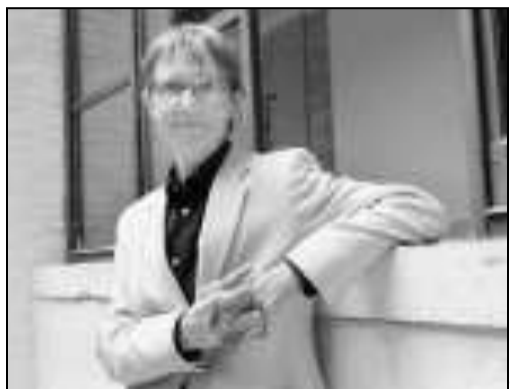
Susanna Tamaro, autrice di un’altra storia al femminile

“Luisito”, un’altra storia tutta al femminile in cui Anselma, una maestra in pensione rimasta sola, ritrova l’amore per la vita grazie a un pappagallo abbandonato. Lei lo chiama Luisito, in ricordo di una compagna di scuola morta di leucemia.