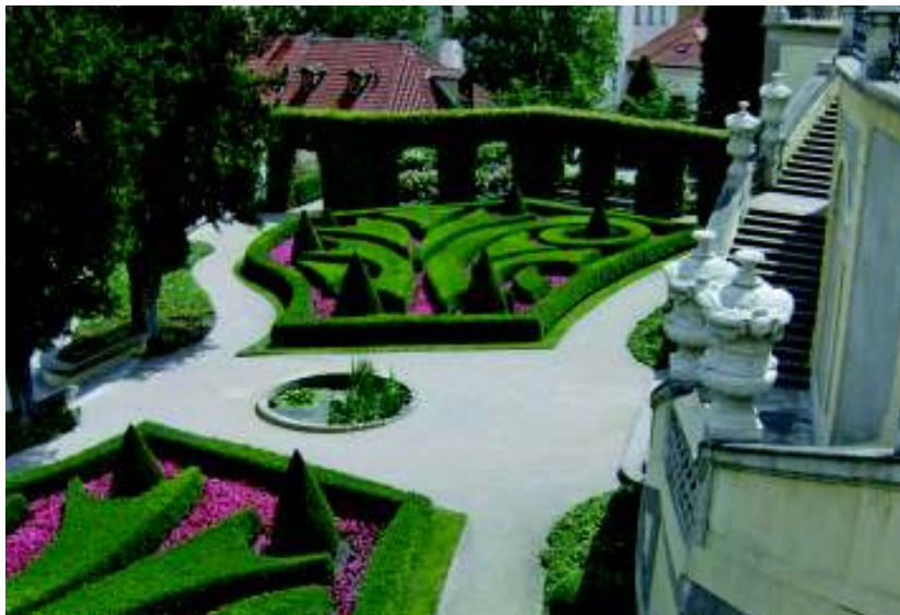
In alto a destra e qui sotto, il giardino Vrtbovska, uno dei più belli di Praga, dall'impianto trapezoidale. In basso a destra, la città vista dalla collina di Petřín.

Il parco della collina di Petřín, che con i suoi 43 ettari è uno dei più estesi di Praga, presenta diversi giardini separati da mura, tra cui il Kinský, il Lobkowitz, il Nebozízek, quello dei fiori, quello delle rose, quello del Seminario e lo Strahov. Riconoscere la collina è facilissimo: basta guardare verso l'alto e se si scorge una minitorre Eiffel significa che si sta guardando dalla parte giusta. La torre offre una meravigliosa vista di Praga e